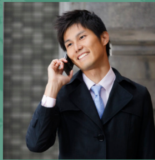
VIAJES DE NEGOCIO