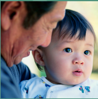
VISITANDO A LA FAMILIA