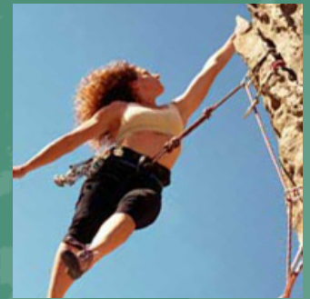
VIAJES DE DEPORTES EXTREMOS

El plan de Atlas de HCC Medical Insurance Services (HCCMIS) est? con usted en cualquier parte del planeta en el que pueden viajar por vacaciones, estudios en el extranjero, viajes corporativos, viajes de misiones y aventuras de los deportes extremos.