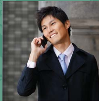
VIAJES DE NEGOCIOS