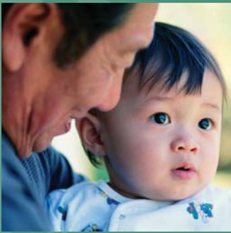
VISITAS A LA FAMILIA