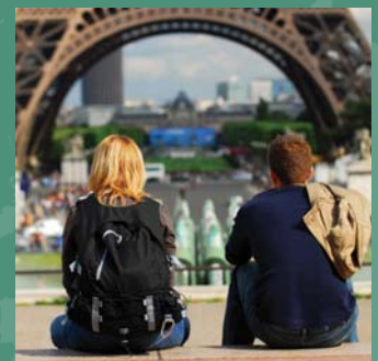
ESTUDIOS EN EL EXTERIOR

El plan Atlas Travel, de HCC Medical Insurance Services (HCCMIS®) está con usted en casi cualquier parte del planeta a la que realice viajes por vacaciones, estudios en el exterior, corporativos y de misión.